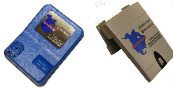
Transpondedores de NORPASS

No hay tasas de participación en NORPASS. Esto significa que no hay cuotas anuales, las re-tribuciones de las luces verde, y no de pago! Sin embargo, el camión debe tener un transpondedor que trabajará en el sistema.